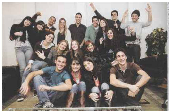
Estagiários da primeira seleção da 141